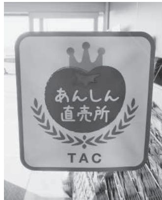
店内にステッカーを貼りPR

組合では、信頼度の一層の向上のためのステップアップとして、今後はGAP(農業生産工程管理)の認定取得も目指していく。