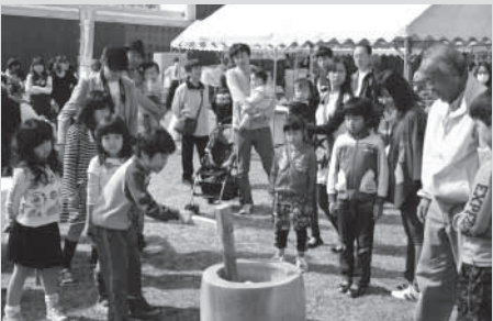
木の良さを知ってもらうため、定期的にイベントを開催している