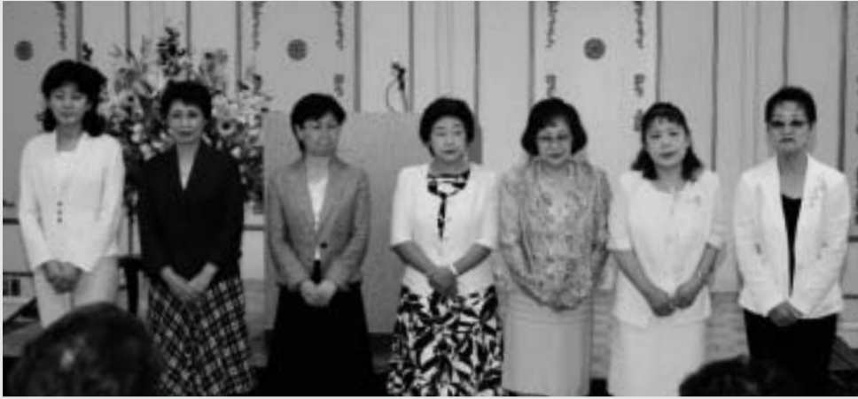
選任された正副会長