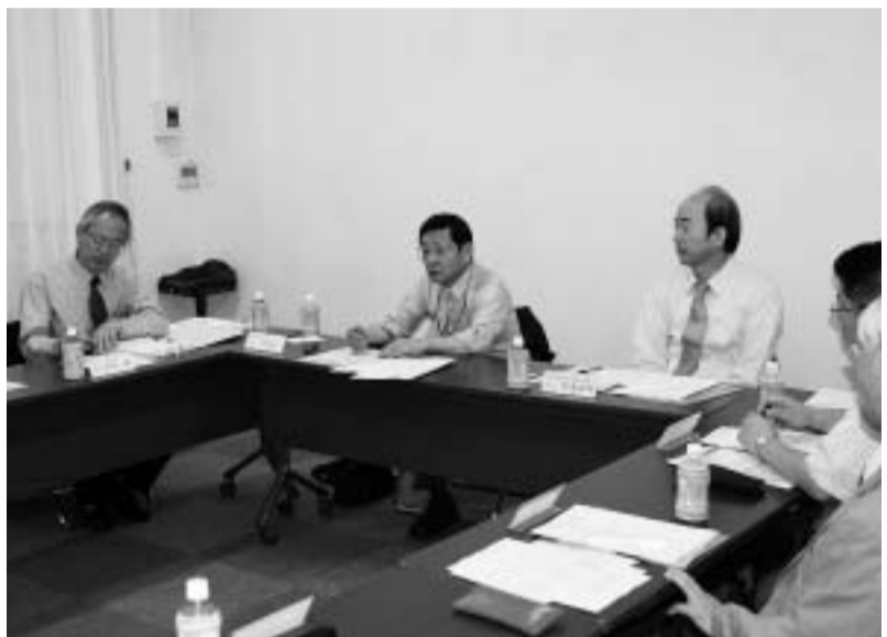
60才以降の継続雇用を検討する達成会議

発行所 山梨県中小企業団体中央会 甲府市飯田2-2-1 中小企業会館4階 TEL 055(237)3215(代) FAX 055(237)3216 http://www.chuokai-yamanashi.or.jp e-mail webmaster@chuokai-yamanashi.or.jp