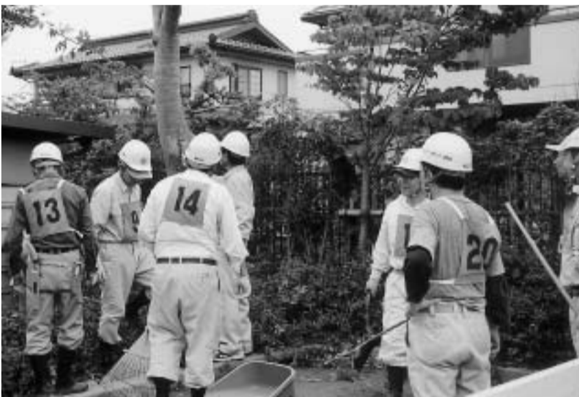
再就職に向けて技能講習を受講する高齢者