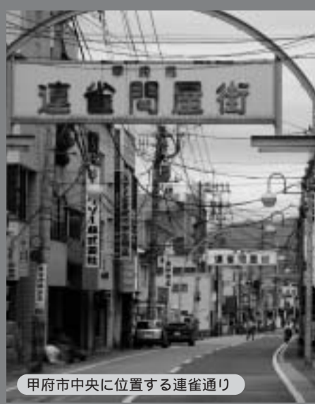
甲府市中央に位置する連雀通り

若い頃はゴルフをやっていましたが、最近では健康のためにウォーキングをしています。