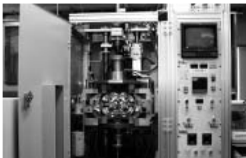
単結晶の製造実験をする「浮遊帯域溶融装置」

単結晶の研究とはどのようなものですか。単結晶は、「異方性(=取り扱う方向によって物質の性質や特性が異なること)」という他の物質(多結晶)にはない性質を持っています。この「異方性」を利用して、電流・光・磁気などを最も効率よく高い精度で制御するための素材として単結晶は様々な使われ方をし