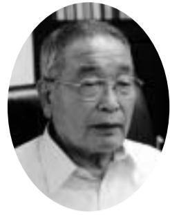
山梨県中小企業団体中央会

暑い日々が続きますが会員の皆様方におかれましては、ご健康に留意のうえ、流した汗が報われる日が近いことを信じ、一層のご奮闘をご期待申し上げます。