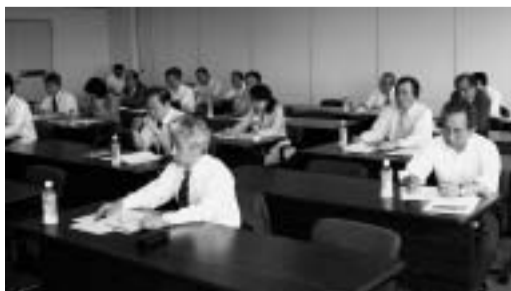
参加者は時間外労働の扱いについて熱心に聴講した