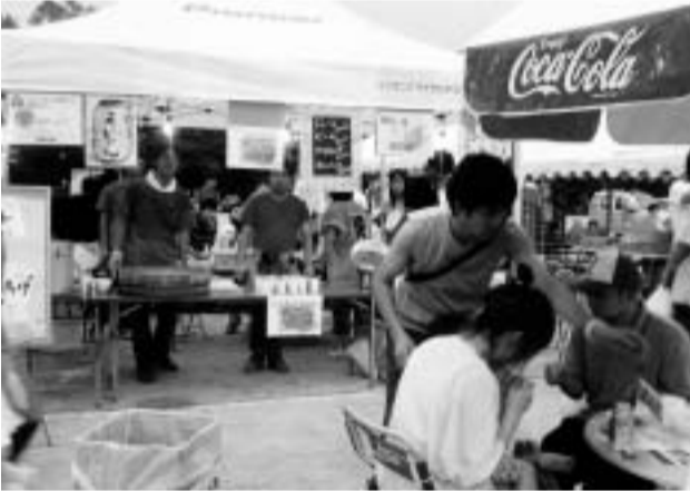
多くの来場者で賑わいを見せた