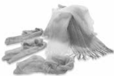
スカーフ・ストール

各出展企業は、産 地の独自性を発揮し て、他産地との差別 化を図るため、富士 山と甲斐絹の伝統を 引き継ぐ、「ふじやま 織」の歴史ある産地 としての地域資産や イメージをさらに有 効活用して、産地ブ ランドの浸透を図っ ていく。