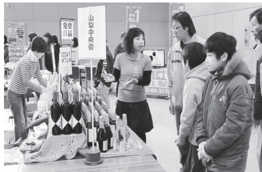
女性部会(やまなし良品)出展の様子

昨年からの女性部会間の交流事業により、今月13日にアイメッセ山梨で開催される中小企業組合まつりへも、長野県アルプス女性企業家会議が出展を行う予定となっており、当日は、「信州なでしこ」のお菓子を販売する。この菓子は、長野県アルプス女性企業家会議の会員がアイデアを出し合い丸山