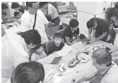
体験教室は大盛況